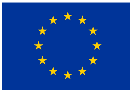
Den Europæiske Union Den Europæiske Hav- og Fiskerifond

Udgifterne til projektet afholdes af bygherre (Thisted Kommune) som har fået tilsagn til afholdelse af udgifterne af Fiskeristyrelsen. Projektet finansieres af midler fra Miljøstyrelsen og Den Europæiske Hav- og Fiskerifond.